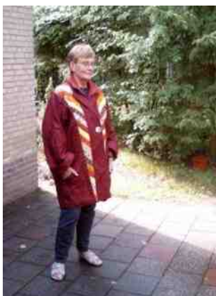
(Hiernaast: Kimono met patchwork banen)